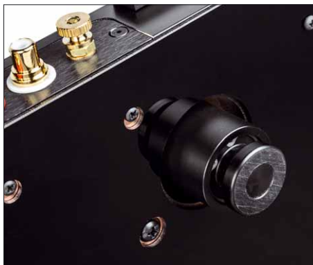
Die Füße isolieren den Ultradeck sehr effektiv von allen Vibrationen der Stellfläche