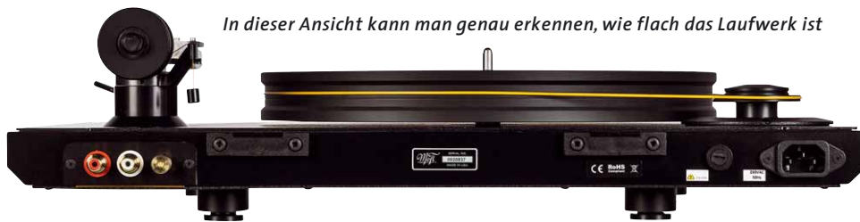
In dieser Ansicht kann man genau erkennen, wie flach das Laufwerk ist