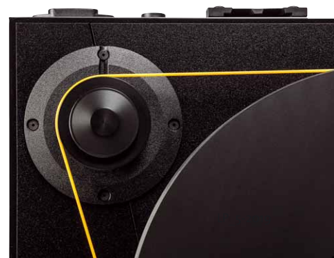
Und auch das recht große Pulley ist aus dem resonanzarmen Kunststoff gefertigt