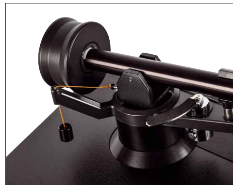
Das Antiskating wird nach alter Väter Sitte mit Umlenkrolle, Faden und Gewicht realisiert