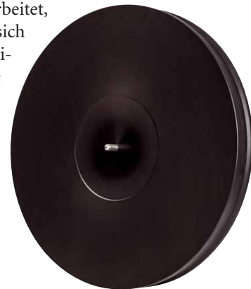
Der Plattenteller besteht aus Delrin – einem Material mit hoher innerer Dämpfung

Technisch ist der Dreher überschaubar, dabei gut gemacht und abgestimmt: ein Wechselstrommotor (ein weiteres Perkins-Muss) sitzt gut abgeschirmt in einer CLD-Sandwich-Zarge aus Aluminium und MDF. Ein invertiertes Lager aus gehärtetem Stahl läuft sehr ruhig in einer Bronzebuchse mit einer Präzisionsstahlkugel auf einem Saphirlager. Dazu kommt der kardanisch gelagerte Tonarm in 10 inch Länge (254 mm), die Perkins für ziemlich ideal hält. Der Arm ist ebenfalls aus Aluminium gefertigt, Teller und Pulley aus Delrin, ein dem Vinyl verwandter Kunststoff. Dazu kommen besagter Rundriemen und gefederte, sehr effektive Isolationsfüße von HRS. Der im „Plus-Paket“ für freundliche 200 Euro Mehrpreis eingebaute MM-Ton-