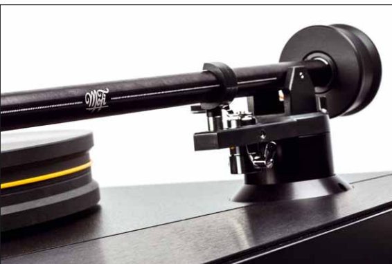
Der ebenfalls selbst gemachte Tonarm ist schlicht, aber von hoher Qualität