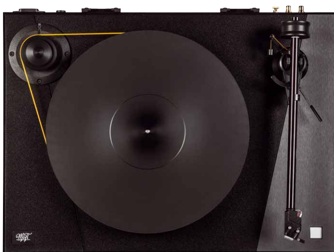
Schwarz mit ein paar gelben Farbtupfern: Der MoFi kommt optisch angenehm unaufgeregt daher

Mobile Fidelity Sound Labs, kurz MFSL oder MoFi, hat bei audiophil veranlagten Musiksammlern einen beachtlichen Ruf. Können sie daran mit ihrem aktuell besten Plattenspieler anknüpfen?