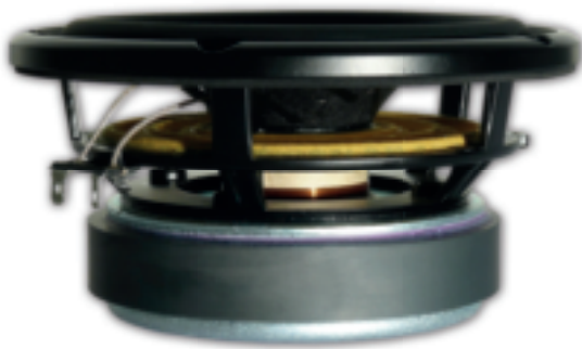
High-End Tieftonchassis mit Super-Magnet