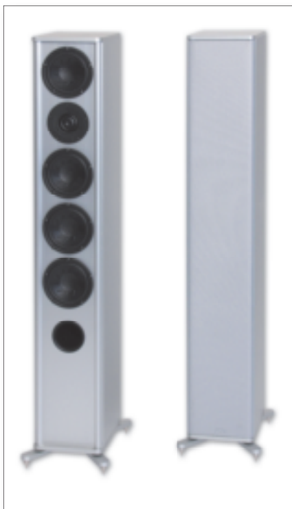
Die Standlautsprecher KS 300, KS 350 und KS ACTIVE liefern wir auch in der Ausführung Gehäuse Alu silber, Deckel Alu silber.