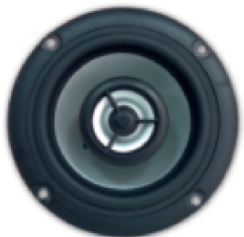
Mittel-Hochtון Koaxialsystem mit 20-mm-Kalotte

Die Lautsprecherchassis der K-Lautsprecher basieren auf den Technologien der High-End-Chassis unserer SOLITAIRE®- und CRITERION-Serien. Sie wurden für den Einsatz in den relativ schmalen Gehäusen weiterentwickelt und modifiziert. Wir verwenden Körbe aus Aluminiumdruckguss, harte Membranen mit versteifender Beschichtung für den Bassbereich und hochdämpfende Spezialmembranen mit versteifenden Prägemustern für die Mitteltöner.