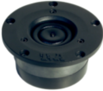
Der legendäre Hochtון Ringstrahler