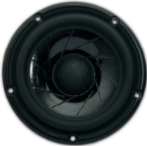
High-End Mitteltonchassis mit Alu-Gusskorb