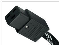
AC-2502 | C19