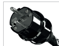
AC-2502 | SCHUKO