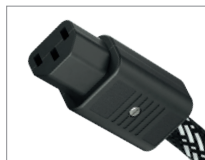
AC-2502 | C13